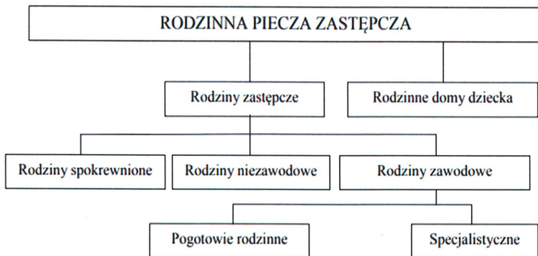
Schemat 1. Podział rodzinnej formy pieczy zastępczej.

Podział rodzinnej formy pieczy zastępczej ilustruje poniższy schemat: