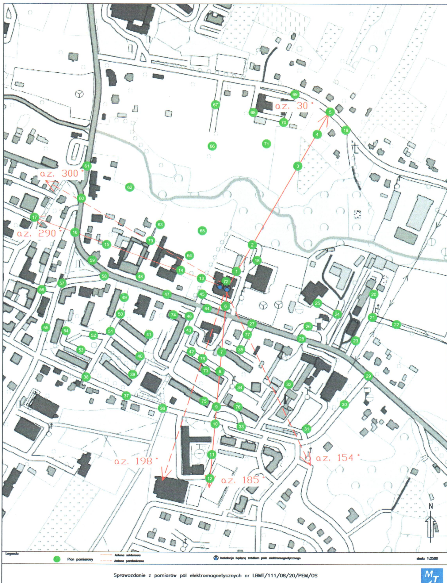
Rys.1 Lokalizacja pionów pomiarowych